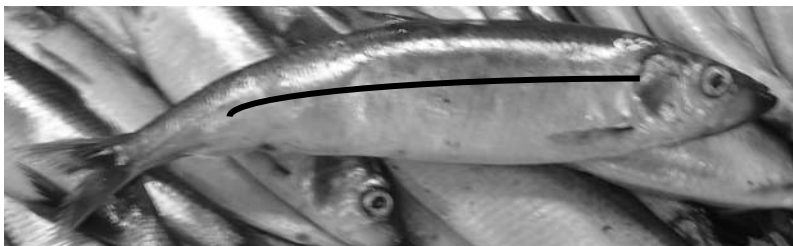
בברכה שניאור ז. רווח