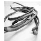
רוביא - לוביא:

כרתי מגידול רגיל: יש לחתוך את החלק התחתון כולל השורש. להפריד את העלים לחלוטין כולל החלק התחתון. יש לחתוך את כל העלים לשניים לכל אורכם. ולהשרות במי אמה למשך 5 דקות. לאחר מיכן יש לשטוף תחת ברז מים תוך כדי שפשוף העלים היטב משני צידיהם.